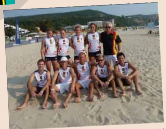
L'ÉQUIPE CHAMPIONNE D'ALLEMAGNE 2011