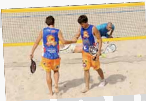
L'ÉQUIPE MASCULINE CHAMPIONNE 2011 DE LA RÉUNION

Forfait entre 100 et 300 euros en fonction des éléments fournis et du nombre de maquettes que nous devons réaliser