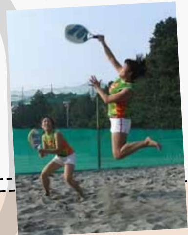
BEACH TENNIS JAPAN